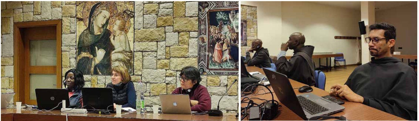
Membres de la présidence du CIOFS et assistants spirituels généraux lors de la réunion de printemps.