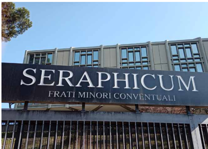
La réunion de printemps de la présidence du CIOFS a eu lieu au Seraphicum à Rome.